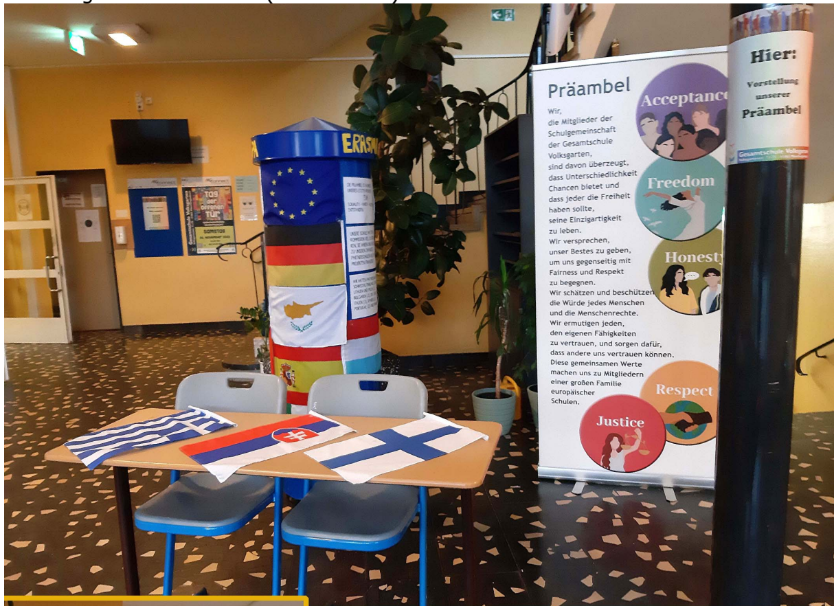
Vom Tag der offenen Tür (26.11.2022):